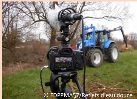
15/03/2016 : tournage du film pendant la phase de traitement de la ripisylve