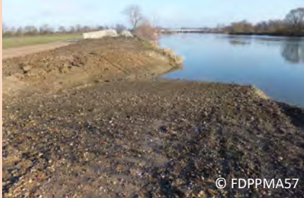
29/01/2016 : rampe en phase de terrassement