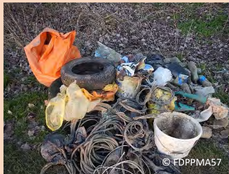
14/03/2016 : déchets d'origine anthropique extraits de l'annexe